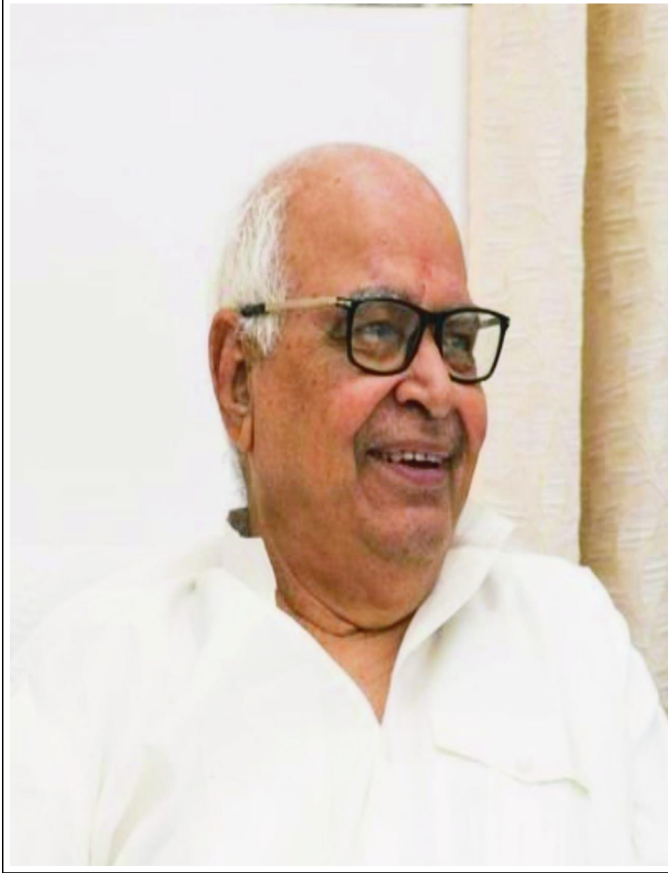
श्री हृदय नारायण दीक्षित अध्यक्ष, विधान सभा, उ०प्र०।